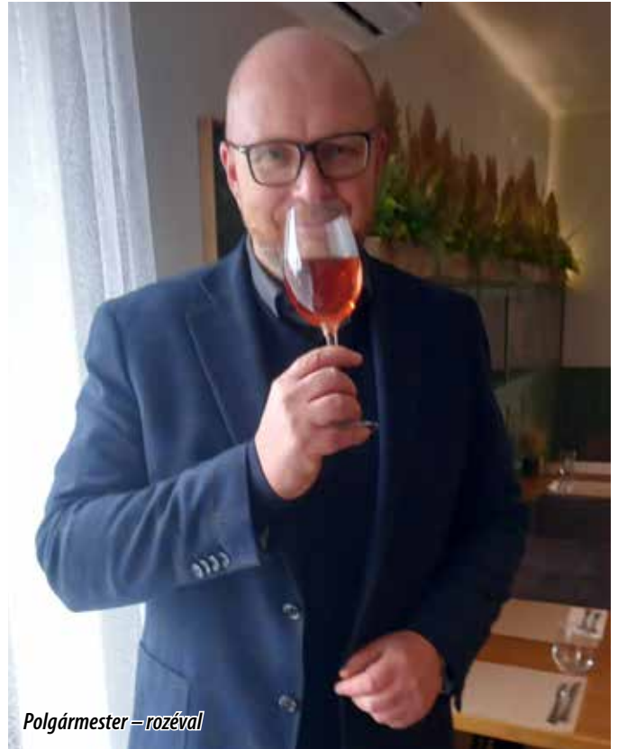
Polgármester – rozéval

Az idei esztendőben az ország tizenhét borvidékének borászatai és termelői neveztek a versenyre . Nagyon sok, szépen elkészített zömében zamatos rozé borok emellett siller, kékszőlőből készült fehérborok, gyöngyöző és habzóborok, valamint pezsgők kerültek a bírálók asztalára.