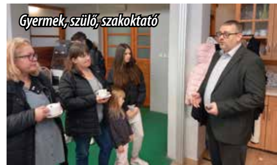
Gyermek, szülő, szakoktató

Gasztró Kupán szeretnék megmérettetni magukat. Két általános iskolát most végző lány érkezik az anyukával, mint kiderült, a szomszédos Biatorbágyról . A lány cukrász