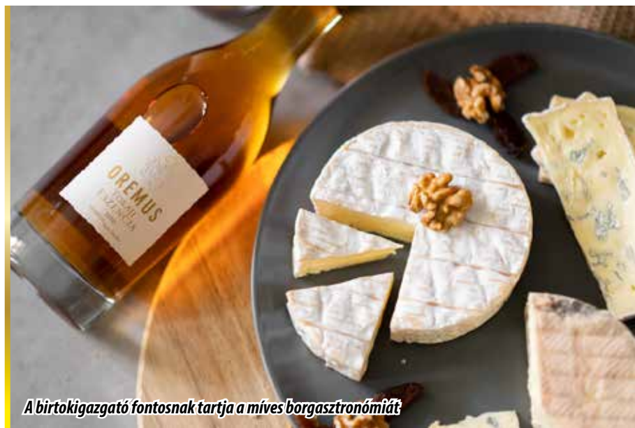
A birtokigazgató fontosnak tartja a mives borgasztrónómiát

– Bizonyára részleteiben ismeri az Oremus történetét. Vizionálhatók-e a következő évek, évtizedek kitérés pontjai?