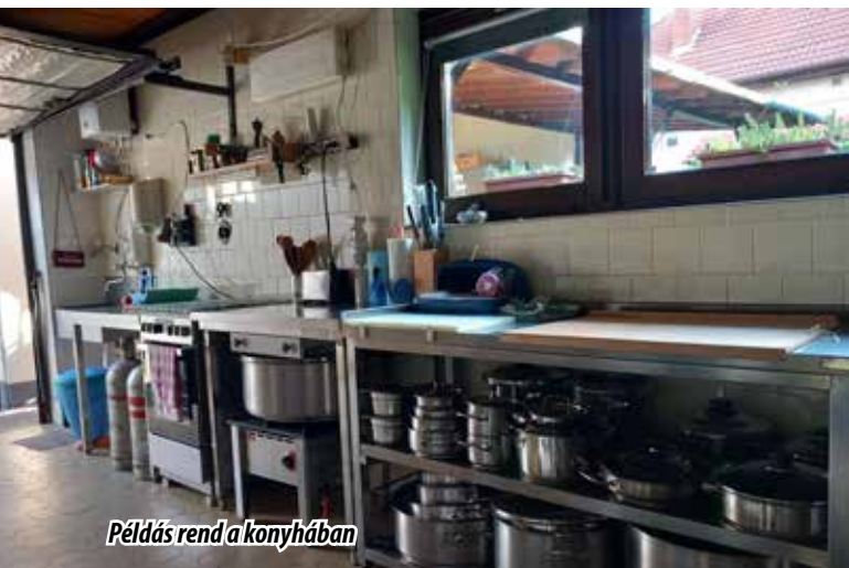
Példás rend a konyhában