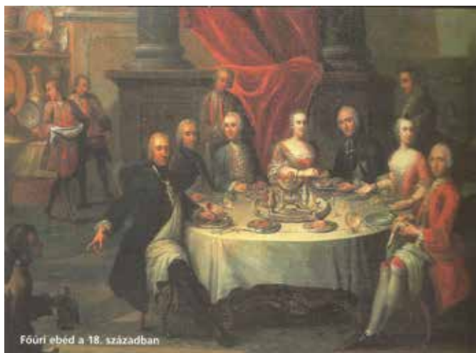
Főúri ebéd a 18. században

mely megmarad és vígasztal akkor, mikor a többi örömet már elvesztettük. 8. A terített asztal az egyetlen hely, ahol az ember az első órában soha nem unatkozik. 9. Egy új ételnek a felfedezése többet járul hozzá az emberi nem sorsának javulásához, mint ha a tudomány egy új csillagot fedez fel. 10. Aki megrontja a gyomrát vagy lerészegszik, nem tud se enni, se inni. 11. Az ételek rendje az, hogy előbb együk a tápláló és utóbb a könnyű eledelt. (Ez az egyetlen az „aforizmák” közül, amivel Gundel Károly nem értett egyet – szerinte pont fordítva kell az ételeket elfogyasztani) 12. Az italok rendje pedig, hogy előbb igyuk a könnyű italt és utóbb a nehezebbet, a kábítót, vagy azt, amelynek aromája van. 13. Eretnek aki azt állítja, hogy csak egyfajta bort kell inni; a nyelv így hamar elveszti a fogékonyságát; a harmadik pohár után a legjobb bort is csak félig-meddig, vagy egyáltalán nem élvezzi az ember. 14. A csemege sajt nélkül olyan leányhoz hasonlít, aki szép volna, de akinek csak félszeme van. 15. A szakács – mesterséget meg lehet tanulni, de ahhoz, hogy valaki sütni tudjon, születni kell. 16. A jó szakács első és legfőbb tulajdonsága: a pontosság; ez az első kötelessége a vendégnek is. 17. Sokáig várakozni egy késlekedő vendégre figyelmetlenség mindazok iránt, akik már megjelentek. 18. Aki vendé-