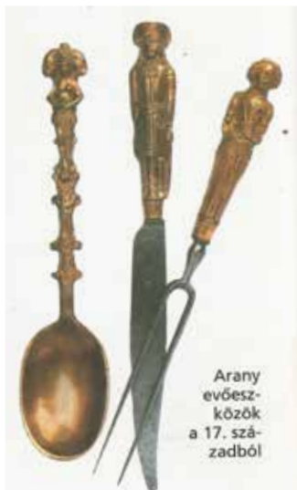
Arany evőeszközök a 17. századból

gül hívja a barátait, de maga nem ügyel rá, hogy mily ebéd készül számukra, nem méltó arra, hogy barátai legyenek. 19. A háziasszony kötelessége gondoskodni róla, hogy a fekete kávé kitűnő legyen; arról, hogy a likőr a legjobb minőségű legyen, a háziúr gondoskodik. 20. Meghívni valakit annyi, mint felelőséget vállalni a jóllétéről mindaddig, míg a fedelünk alatt marad.