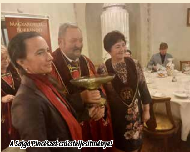
A Sajgó Pincészet csúcsteljesítménye!

Az I. Borlovagok Borversenyének Champion díját, MBOSZ különdíját, valamint a 2024. évi VI. Kárpát-medencei Borrendi találkozóra az MBOSZ megvásárolja a díjnyertes bort és a találkozó főbora lesz – Tolcsva Bor Kft./Sajgó Pincészet legmagasabb pontszámot elért bora nyerte: tokaji hatputtonyos Aszú.