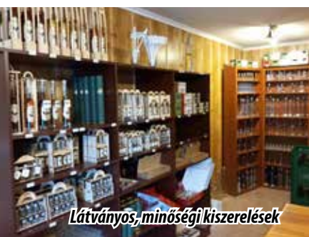
Látványos, minőségi kiszérések

lői vonal egyre vékonyodik, alapanyag problémákkal kell szembenéznünk, a kézi szedés – akárcsak a szőlőágzatban vagy más gyümölcsöknél – minimálisra csökkent. Ezért még jobban felértékelődik a további gépesítés, ami pedig nyilván az árnál is megmutatkozik majd. Most tehát bizonyos tétováságban vagyunk a következő esztendőkre szólóan, más okok miatt is. Ez pedig a jogszabályi változás! A termékdíj mértéke 8-10 szeresére növekedett, ez vonatkozik a dobozra, dugóra, címkére, üvegre. Ha pontosan meg akarjuk határozni ennek visszahúzó következményét, a