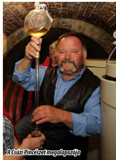
A Csúzi Pincészet megalapozója

– Bátyám megvásárolta, a szemközt állva balra eső pincét és olyan vendégfogadó, szállást is kínáló helyszínt sikerült mostanra csaknem teljesen kialakítani, amely a vendéglátáson belül a rendezvényturizmus mi-