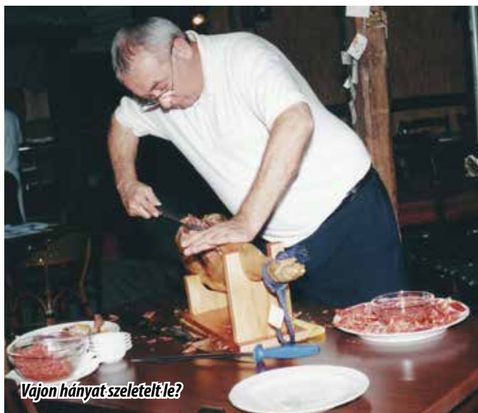
Vajon hányat szeletelt-le?

dó barátságom, melynek köszönhetően a szakma csúcsáig jutottam el a főzés és az árukezelés terén. Hosszú évekig, amint csak lehetett rengeteg praktikát és ételké-