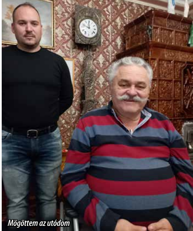
Mögöttem az utódom