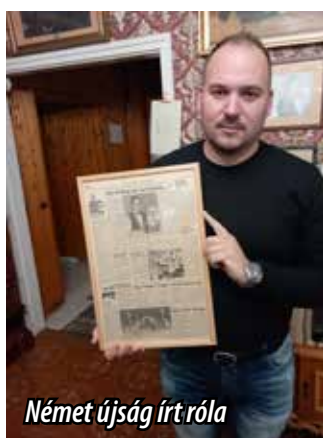
Német újság írt róla

DÉL-BALATON NÉPSZERŰ FÜRDŐHELYE FONYÓD VÁROSA, A NAGY BEREK MELLETT, HOSSZÚ PARTSZAKASSZAL, MAGÁBA FOGLALVA FONYÓDLIGETET, BÉLATELEPET, ALSÓBÉLATELEPET, KÉT OLYAN MAGASLATTAL IS RENDELKEZIK, AMELYIK KÉTSZÁZ MÉTER FELETTI. AZ EGYIK A SIPOS, A MÁSIK PEDIG A VÁR -HEGY.