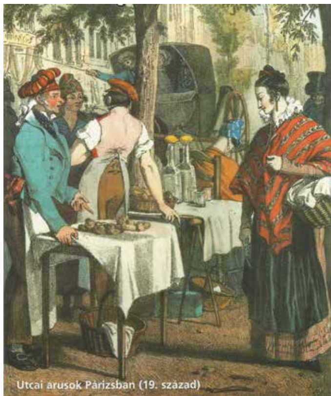
Utcai árusok Párizsban (19. század)

Az egyik ilyen bizonyos értelemben mindmáig klasszikusnak nevezhető munka 1788-ban Hannoverben látható napvilágot Adolf Freiherr Knigge tollából „Umgang mit Meschen” címmel. Magyarul 1798 és 1821 között három kiadást is megélt „Az emberek közötti érintkezésről” címmel. A vendéglátásról ezt írja: „Azt a keveset a’ mit a’ vendégeskedésre áldozhatunk, adjuk illendő mértékben, jó módjával, tiszta szívből ’s nyájas ábrázattal. Barátunknak vagy akárkinek megvendéglésében ne annyira igyekezzünk pompát, mint rendet és barátságot mutatni. Ne látassunk megijedni ’s megháborodni, ha váratlanul lep meg valaki bennünket. Semmi sem lehet kedvetlenebb dolog, mint midőn észrevesszük, hogy gazdánknak a’ vendéglés nehezére esik, hogy nem örömet, hanem tsupa emberségből ád, vagy nagyobb költségeket tesz, mint körülállásai engedik. Nem vet jó fényt a vendéglátókra, ha a feleség minden falatunkat megoldvassa, ha oly kevés vagyon a’ tálokba, hogy mindenkinek tányérjára elegendő nem jut, ha a’ gazda ’s a’ gazdasszony az evésre ’s ivásra úgy eröltetnek, mintha azt mondanák: már el van készítve: töltsétek meg hasatokat, lakjatok most