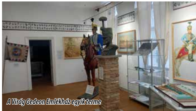
A Virág Gedeon Emlékház egyik terme

- Városunk nagy történelmi hagyományokkal rendelkezik és például a „Szentmiklósi Napok” Országos Birkafőző Verseny sikere hosszú évek óta arra utal, hogy olyan vendégfogadó programokat kell szerveznünk, amelyek a mi gasztronómiai kultúránkat is jellemzik. Testvérvárosunk, Karcag már megtette a maga szolgálatát azzal, hogy a birkát, mint hungarikumot a nemzeti érték szintjére emelte. A mi programunk is ehhez kapcsolódik. De érdemes idejönni, megtekinteni a Virág Gedeon Emlékházat, amely átadása óta egyre népszerűbb és vonzó helyszín. Az utolsó aradi fogoly a