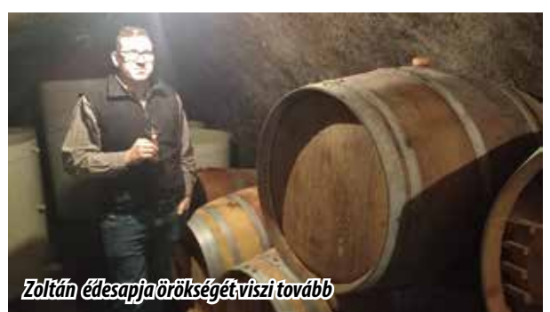
Zoltán édesapja örökségét, viszi tovább