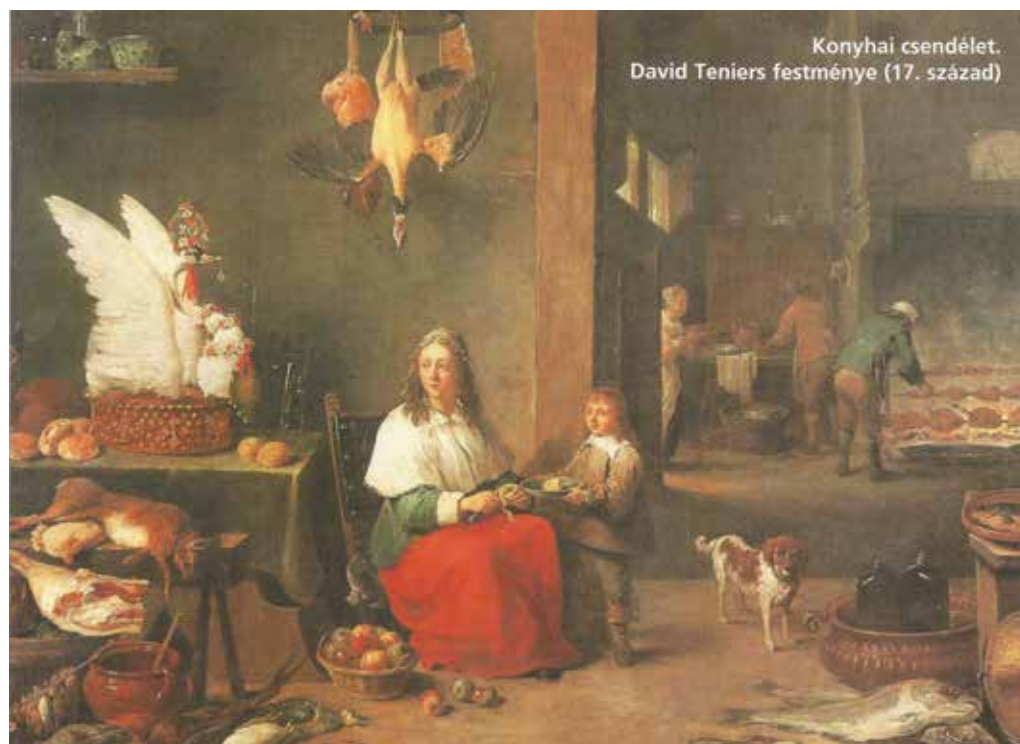
Konyhai csendélet. David Teniers festménye (17. század)

sokszorozódott. (leveses kanál, desszert és fagyaltkanál, befőtteskanál, mokaikanál, mártásoskanál, halvilla, oszt-rigavilla, rákvilla, gyümölcs-