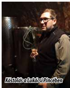
Kóstolás a Lukácsy Pincében