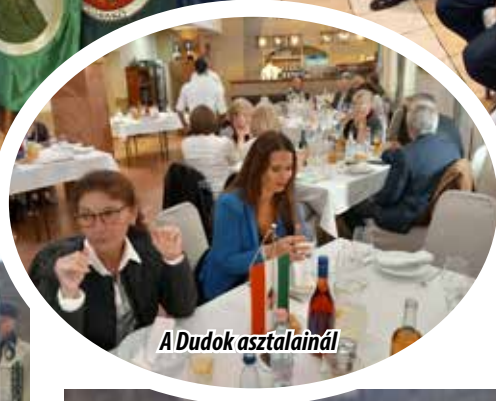
A Dudok asztalainál